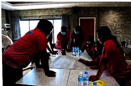
แบ่งกลุ่มฝึกปฏิบัติเกี่ยวกับกระบวนการ “ชุมชนการเรียนรู้ทางวิชาชีพ (Professional Learning Community : PLC)”