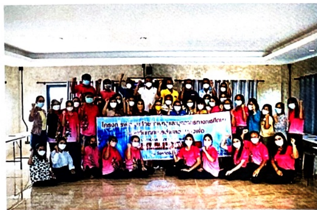
คณะผู้บริหารถ่ายภาพหมู่ร่วมกับวิทยากรและผู้เข้าร่วมโครงการ