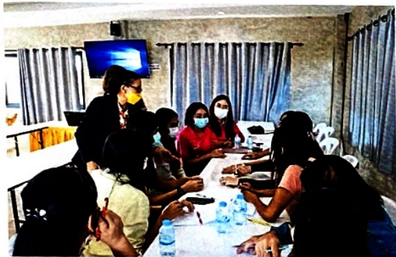
แบ่งกลุ่มฝึกปฏิบัติเกี่ยวกับกระบวนการ “ชุมชนการเรียนรู้ทางวิชาชีพ (Professional Learning Community : PLC)”