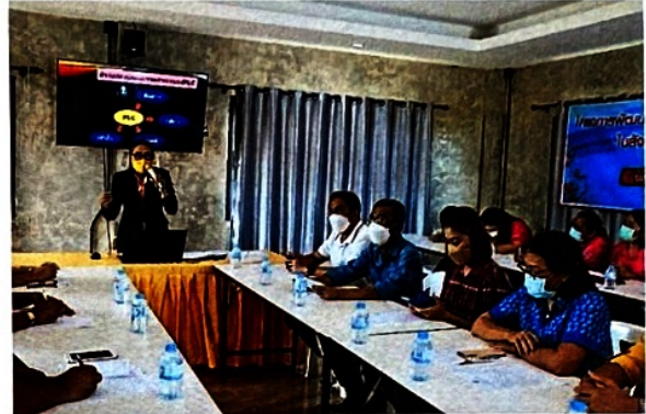
วิทยากรบรรยายให้ความรู้ เรื่อง “ชุมชนการเรียนรู้ทางวิชาชีพ (Professional Learning Community : PLC)”