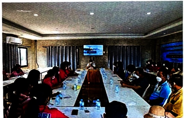
นายไมตรี ประเสริฐ นายกเทศมนตรีตำบลดอนหัวฬ่อ มอบนโยบายการปฏิบัติงานด้านการศึกษาแก่ผู้เข้าร่วม