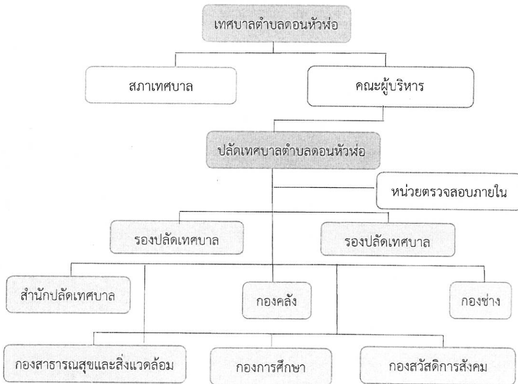
รูปที่ ๑ โครงสร้างเทศบาลตำบลดอนหัวฬ่อ